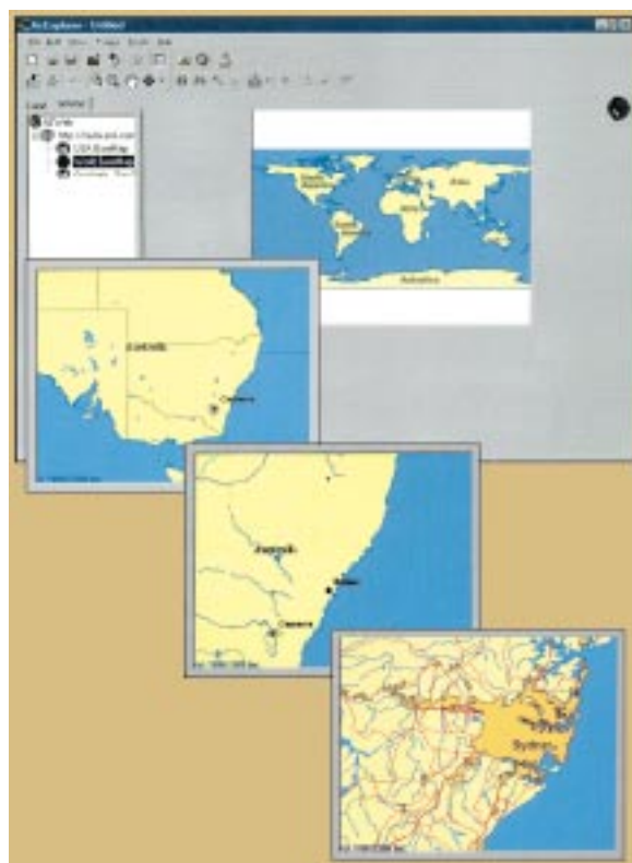
Рис. 2. Поиск географических объектов с помощью системы ArcExplorer [6]. Экраны иллюстрируют последовательный переход от карты мира к австралийскому городу Сиднею, для которого затем можно запросить справочную информацию

Еще один интересный пример – Интернет-атлас Швейцарии, страны, имеющий глубокие традиции