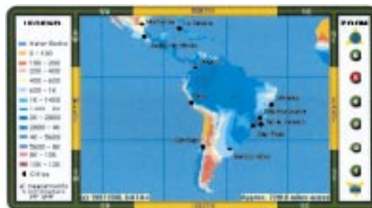
Рис. 3. Карта годового распределения осадков в Южной Америке – пример учебно-справочной карты из Интернета

Пользователи Интернета, как правило, не имеют достаточной картографической подготовки, причем чем дальше, тем все более многочисленные группы некартографов вовлекаются в составление компьютерных карт. Поэтому пора думать о повышении уровня картографического образования самих преподавателей и специалистов в науках о Земле, экологов, социологов и экономистов, администраторов, бизнесменов, да и просто широких кругов путешествующего, отдыхающего, интересующегося политическими новостями населения.